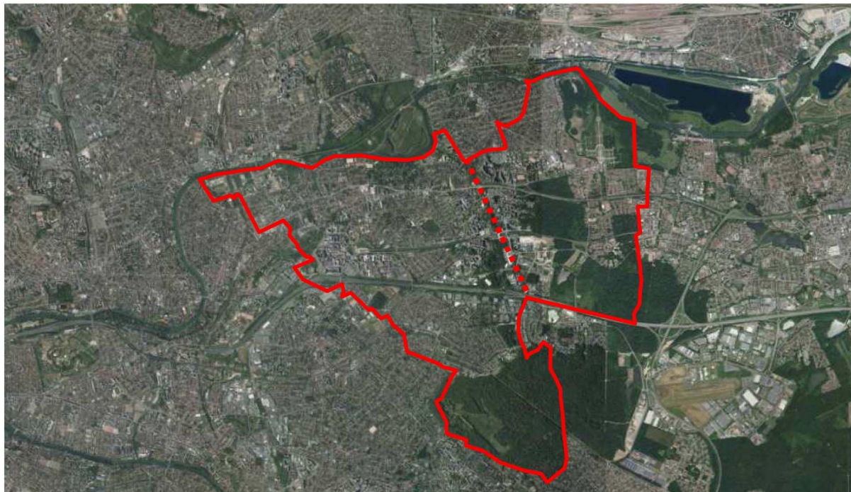
Périmètre de contractualisation du CDT (issu du document du CDT)

La gare du RER A de Noisy-Champs (ouverte en 1980) est localisée à la limite des deux communes, et dessert notamment la Cité Descartes 6 . La nouvelle gare 7 abritera en plus le terminus de la ligne 15 (ex rouge) du Grand Paris express (Pont-de-Sèvres-Noisy-Champs), et a vocation à être également le terminus des lignes 11 (prolongement de la ligne 11 jusqu'à Noisy - Champs confirmé le 6 mars 2013 par le Premier ministre) et 16 (vers Saint-Denis Pleyel). Le territoire du CDT se situe donc à un nœud de communication stratégique des grandes lignes de transport en commun du Grand Paris express.